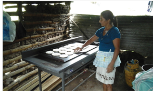
Prestataria de CrediManá - Tortillería

Las principales actividades económicas de sus prestatarias, que en su mayoría son mujeres de áreas rurales son: