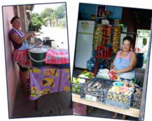
Prestatarias de CrediManá

En la etapa anterior al proceso de acompañamiento GIF, el tema de la sucesión de cargos críticos había sido un tema muy poco discutido, aunque se encontraba en el centro de las preocupaciones institucionales. A través del proceso con el Proyecto GIF se ha aprendido la importancia de planificar cuidadosamente el proceso de sucesión, tanto en los cargos de la Dirección Ejecutiva como de los otros cargos directivos. Ahora está claro que esta temática debe ser explícita, planificada y ampliamente discutida por todos los directivos de la institución.