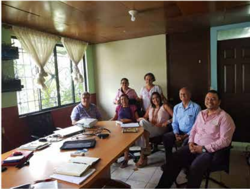
Comité de Gobernanza de CrediManá