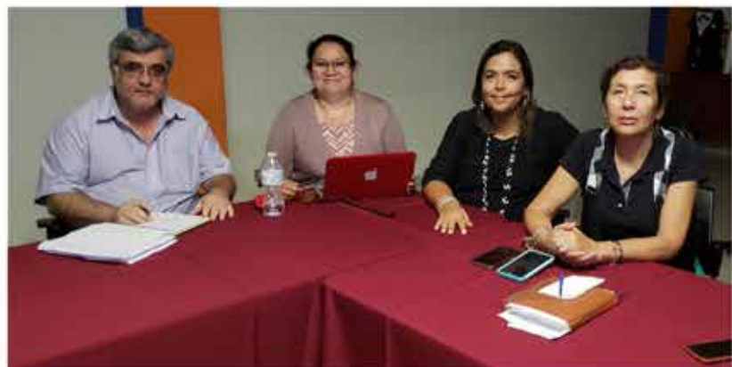
Junta Directiva CrediManá