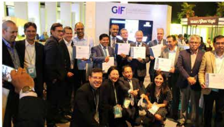
Entrega del Certificado de Mejora de la Calidad de Gobernanza en FOROMIC (Barranquilla, octubre de 2018)

El proceso de acompañamiento GIF ha dejado una tarea importante en cuanto a continuar fortaleciendo la dimensión de control de su gobernanza. Está claro que esta dimensión de la gobernanza es crítica para la sobrevivencia de la entidad en el largo plazo. Por ello, se ha identificado con claridad la necesidad de fortalecer los sistemas, manuales y procedimientos de control interno y gestión de riesgos, con el trabajo coordinado en los comités de auditoría y riesgos. Aunque CrediManá es una entidad pequeña se ha aprendido a valorar la importancia de estos sistemas.