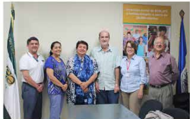
Junta Directiva ENLACE