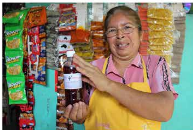
Prestataria de ENLACE

El involucramiento de la Alta Gerencia en la elaboración de normas y políticas relacionadas a sus áreas, ha fortalecido la comunicación fluida entre la Alta Gerencia y la Junta Directiva, coadyuvando a una mejora en la gobernabilidad y gestión de Enlace.