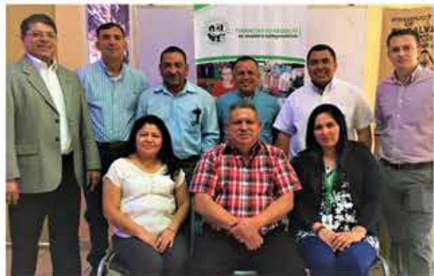
Comité de Gobernanza PADECOMSM