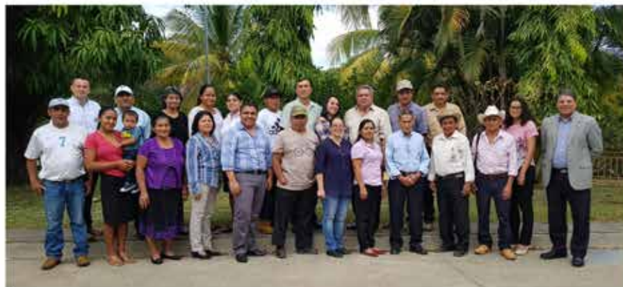
Asamblea General Extraordinaria 2018 para aprobación de Código de Gobierno Corporativo

La metodología y las herramientas GIF han dejado un legado fundamental para fortalecer las capacidades internas en materia de gobernanza. Durante el proceso se han elaborado los propios reglamentos y políticas en materia de gobernanza bajo la metodología de "aprender haciendo," lo cual ha mejorado la comprensión de los estándares internacionales de gobernanza y permitirá manejar este proceso de autoevaluación de manera interna hacia el futuro.