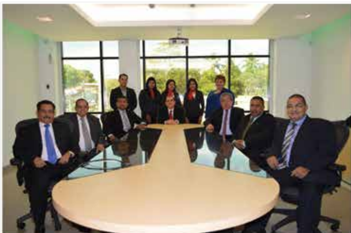
Comité de Gobernanza y Equipo Gerencial de CCSV