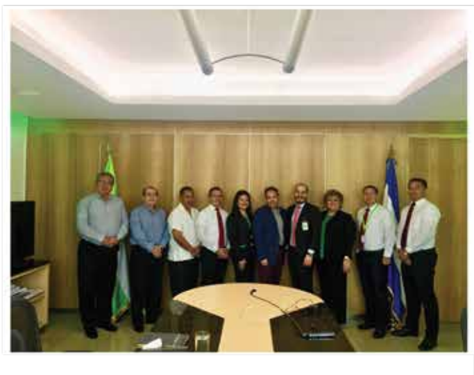
Sesión evaluatoria con el proyecto GIF